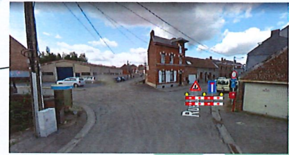
RUE EDMOND LENGRAND